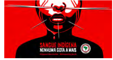
La campagne de l'APIB : « Pas une goutte [de sang] de plus »

Pour lire la suite : ( https://www.autresbresils.net/Bresil-Les-peuples-autochtones-en-resistance )